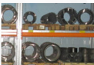
Сателлиты и ведущие шестерни планетарных редукторов ЭКГ