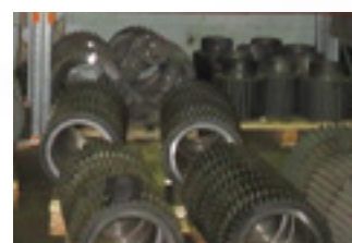
Склад производства шестерен

ПРОИЗВОДСТВО ЗАПАСНЫХ ЧАСТЕЙ ДЛЯ ТЕЖЕЛОЙ ТЕХНИКИ