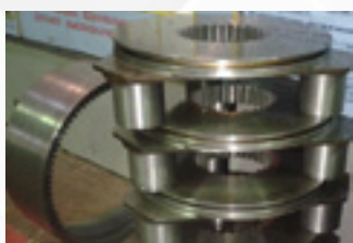
Колесо центральное, 3-х лучевое водила