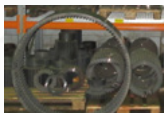
Колесо центральное, шестерни ведущие, сателлиты